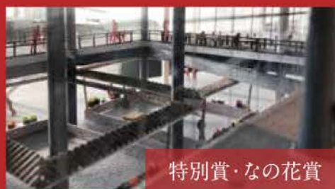
特別賞・なの花賞