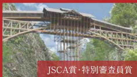
JSCA賞・特別審査員賞