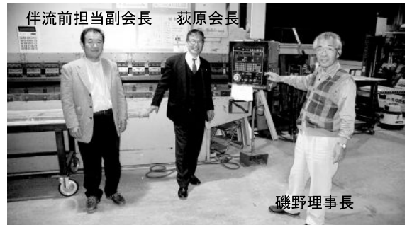
超幅広加工機 (コンピュータ制御で円柱も可能)

神社仏閣の屋根工事は一般住宅の施工部分に加えて伝統的意匠やその美観が求められます。そのためには、折る、曲げる、叩く、をもとに蓄積したノウハウを応用する高度な技術が要求されます。