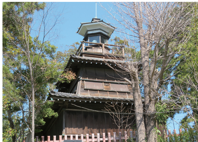
▲船橋大神宮灯明台

ただき常磐神社など改めて理解しました。灯明台も内部を見学できる時があるとの情報もいただき再度見学に行きたいと考えています。